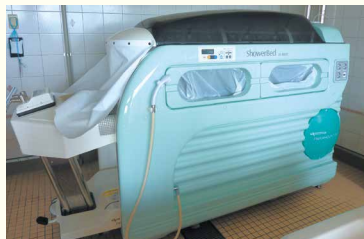
・ストレッチャー浴槽

実際に、入居者さまからも「よく温まって気持ちがいいのよ～」との声をいただいています。