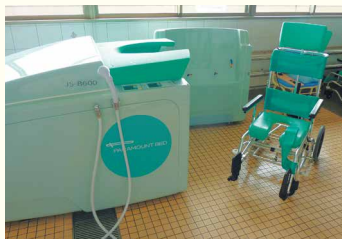
・チェアーイン浴槽