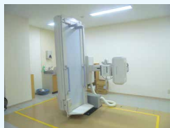
X線(レントゲン)透視装置