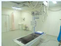
X線(レントゲン)撮影装置